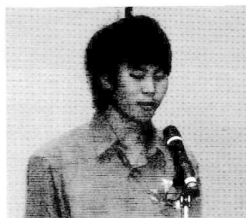
ウオンテジャ ノン (タイ)