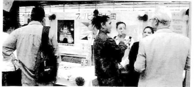
フィリピン コーナー