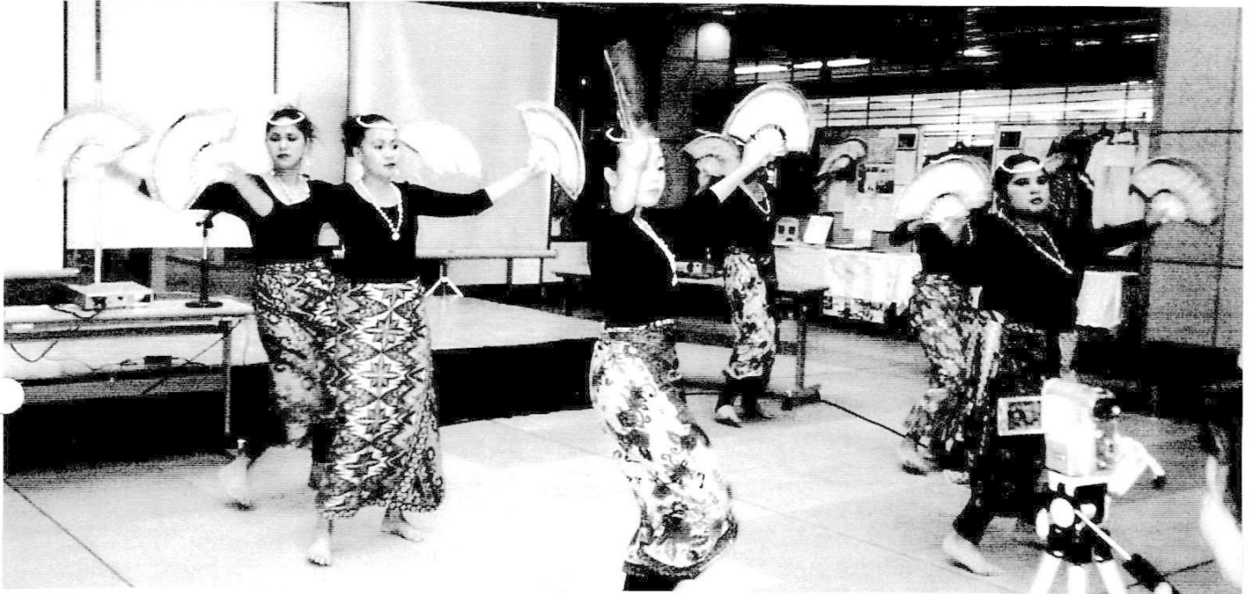
島の祭りの踊り フィリピン グループ