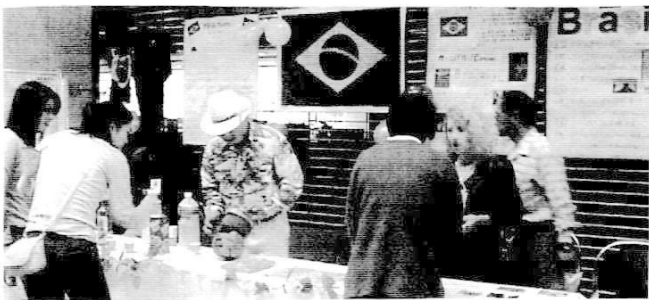
ブラジル コーナー