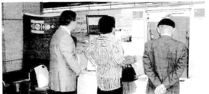
モンゴル・ウイグル コーナー