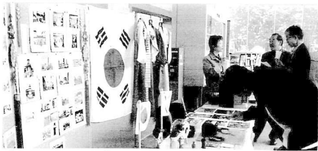
韓国 コーナー (野田郵便局出展)