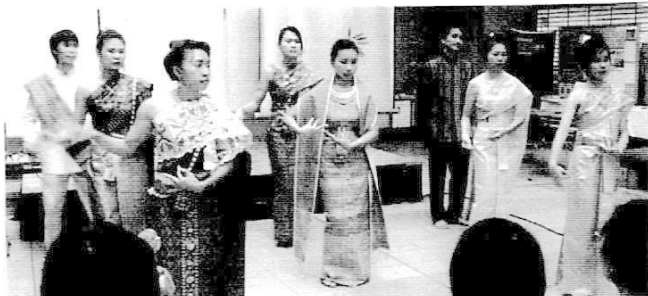
ライカトーン(祭り)の踊り タイ グループ