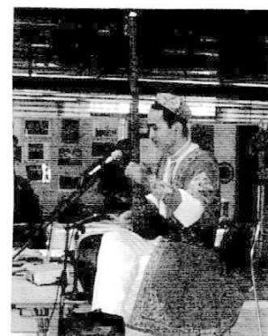
ウイグル楽器タンブル演奏 (ブラジル)